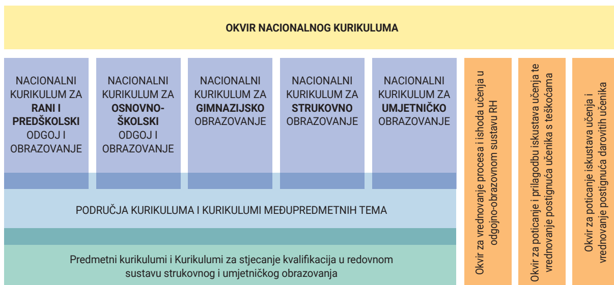
Slika 2: Sustav nacionalnih kurikulumskih dokumenata izrađenih u prvoj dionici Cjelovite kurikularne reforme

Osim po sveobuhvatnosti elemenata koje obuhvaća, reforma je nazvana cjelovitom i zato što se odnosi na sve razine i vrste dovisokoškolskog odgoja i obrazovanja. U sklopu Cjelovite kurikularne reforme prvi je put uspostavljen i razrađen hijerarhijski organiziran sustav nacionalnih kurikulumskih dokumenata kojima se na nacionalnoj razini iskazuju namjere povezane sa svrhom, ciljevima, očekivanjima, ishodima, iskustvima djece i mladih osoba, s organizacijom odgojno-obrazovnog procesa i s vrednovanjem (slika 2).